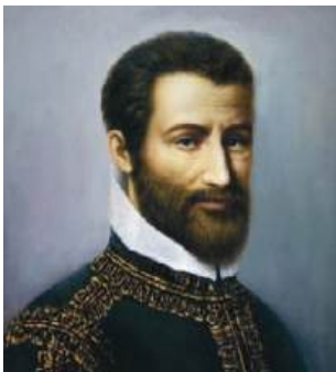
Tomás Luis de Victoria