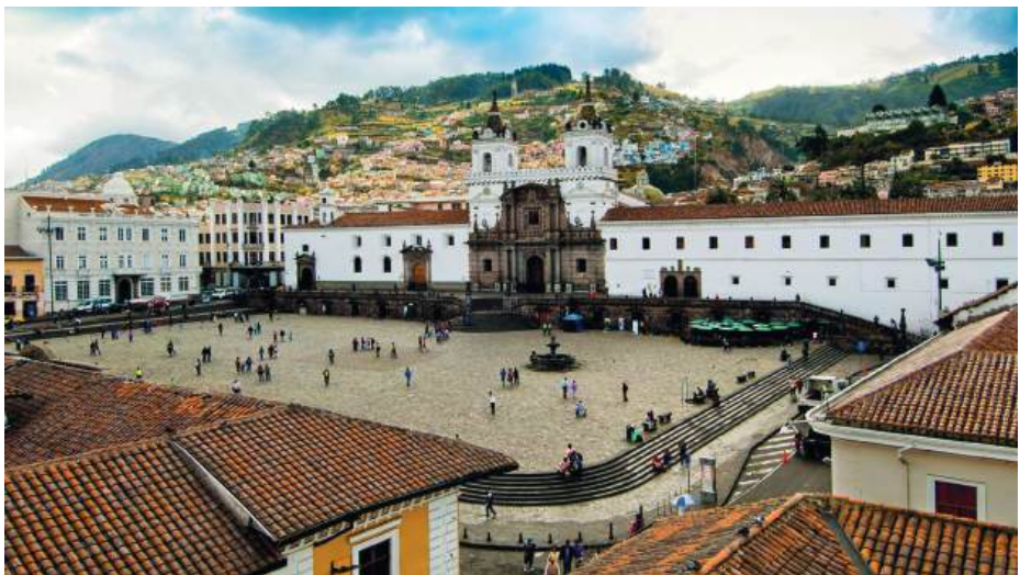
Quito in Ecuador

Hemel en aarde zegene u O Maagd, puur en heilig Ja, u bent onze pleitbezorger Moeder Gods van Antigua.