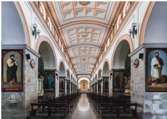
Kathedraal van Ibarra