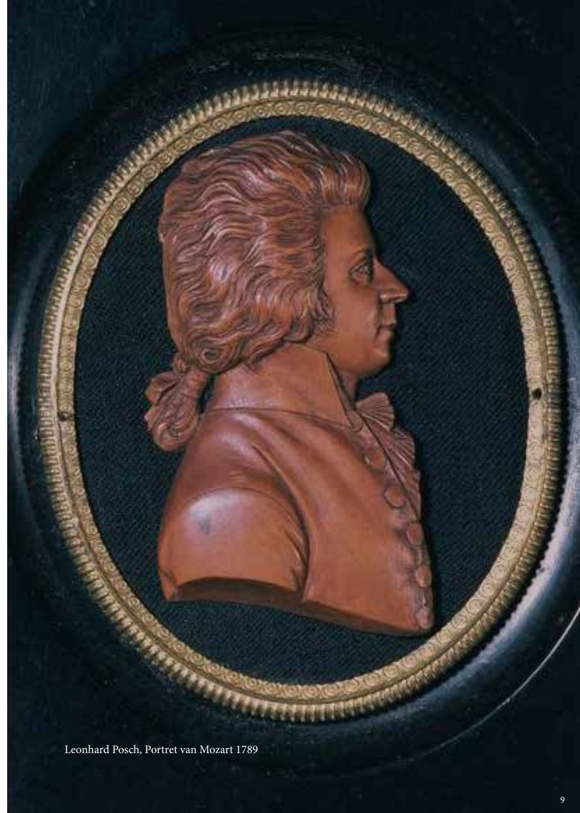
Leonhard Posch, Portret van Mozart 1789

Christoph Wolff (2012). Mozart at the Gateway to his Fortune. Serving the Emperor, 1788-1791 . New York en Londen: Norton & Company