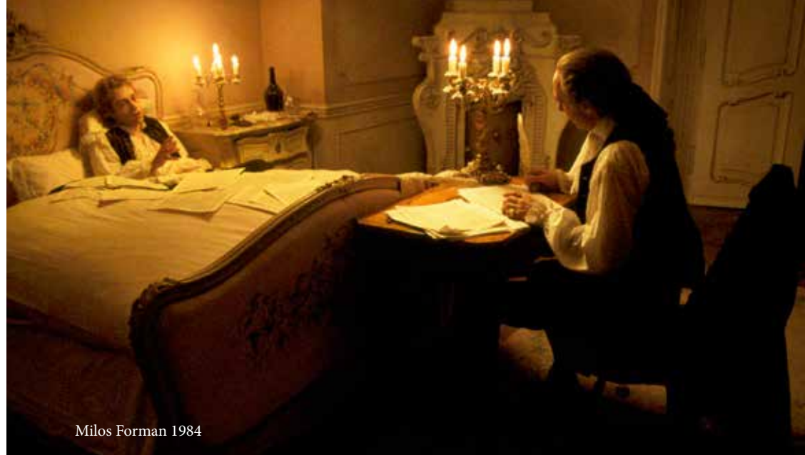
Milos Forman 1984

LBE is een Algemeen Nut Beogende Instelling.