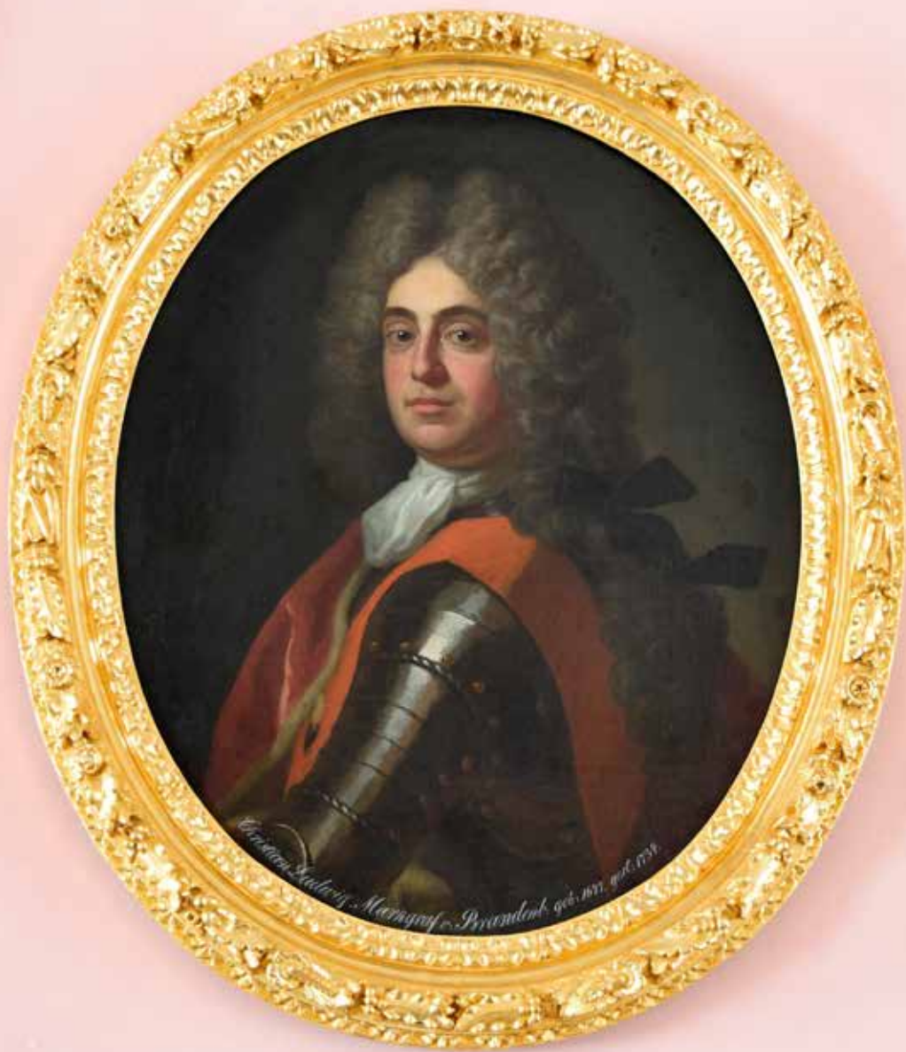
Portret van Christian Ludwig, markgraaf van Brandenburg